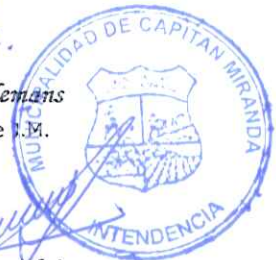
Basilio Gura Hain Intendente Municipal