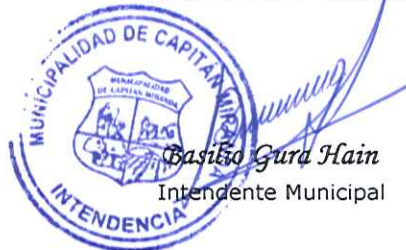
Basilio Gura Hain Intendente Municipal